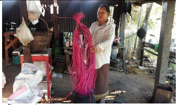
ขั้นตอนที่ 4 คือ ย้อมด้วยสารเคมีด้วยวิธีการย้อมร้อน