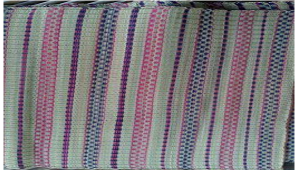
ขั้นตอนที่ 6 การทอเสื่อกกเสร็จเรียบร้อยแล้ว