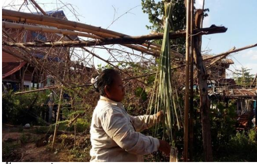
ขั้นตอนที่ 3 คือ นำกากไปตากแดดให้แห้ง