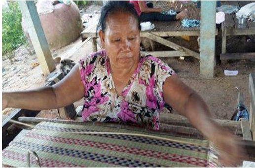
ขั้นตอนที่ 5 คือขั้นตอนการทอเสื่อกก