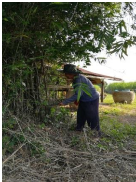
ขั้นตอนที่ 1 การตัดไม้ไผ่