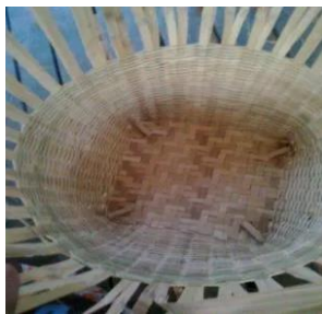
ขั้นตอนที่ 4 การสานก่อกเป็นรูปตะกร้า