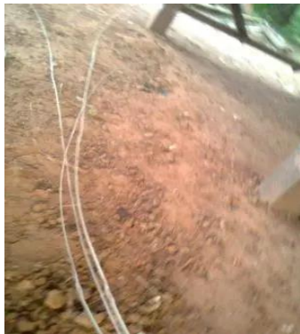
ขั้นตอนที่ 2 การผ่าไม้ไผ่ทำเป็นเส้นตอก