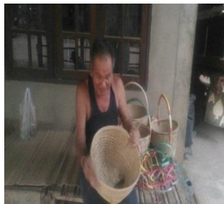
ขั้นตอนที่ 5 การใส่หว่งตะกร้า