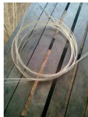
ขั้นตอนที่ 3 การจักตอก