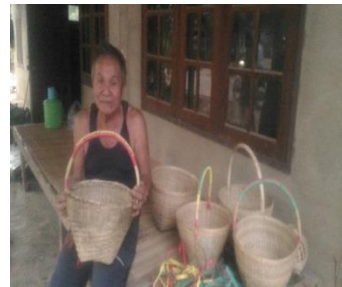
ขั้นตอนที่ 6 การสานตะกร้าเสร็จเรียบร้อย