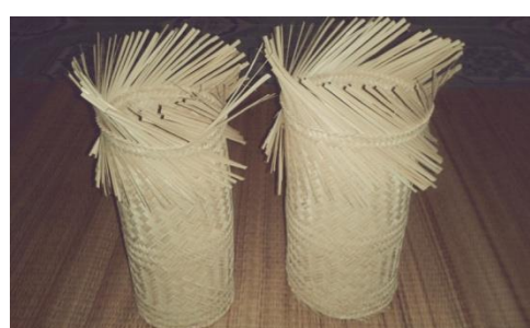
ขั้นตอนที่ 3 การสานตัวกระติบข้าว