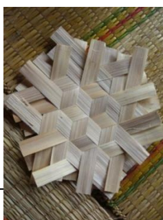
ขั้นตอนที่ 5 การสานฝาและกัน