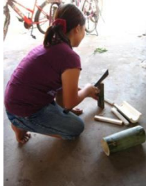
ขั้นตอนที่ 1 การผ่าไม้ไผ่