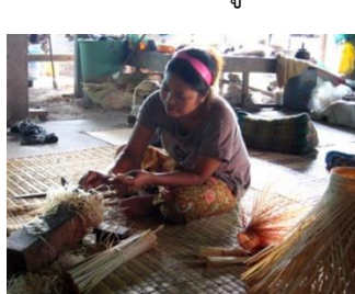
ขั้นตอนที่ 2 การขูดตอก