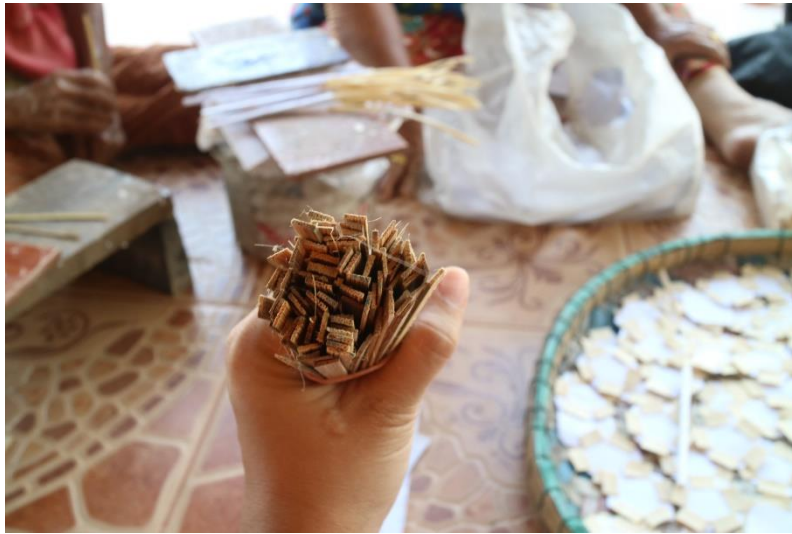
๑.๕ กาว (ทำจากแป้งมัน)