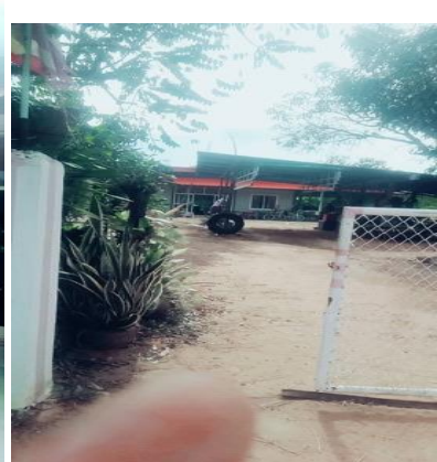
ภาพภายในบริเวณบ้านของคุณพ่อสตีต